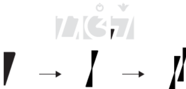
Gambar 3. Proses Perancangan Ikon OPK Pengetahuan Tradisional

Berdasarkan hasil perancangan logo utama OPK Kota Bandung, didapatkan bentuk-bentuk sederhana yang kemudian dimodifikasi agar lebih mudah dipahami. Proses perubahan bentuk ikon OPK Pengetahuan Tradisional dari bentuk sederhana menjadi bentuk ikon ditunjukkan pada Gambar 3.