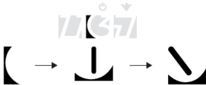
Gambar 5. Proses Perancangan Ikon OPK Teknologi Tradisional

Proses perancangan ikon OPK Teknologi Tradisional dari bentuk sederhana menjadi ikon ditunjukkan pada Gambar 5.