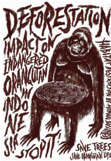
Gambar 2. Poster Deforestation