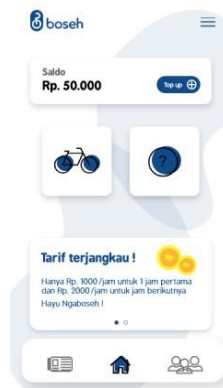
Gambar 3. Media Utama

Dalam proses pembuatan UI media utama ini menggunakan Aplikasi Adobe XD cc 2019 dengan ukuran 360 x 640 px