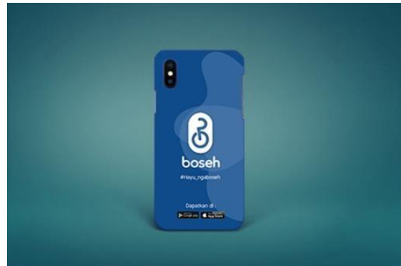
Gambar 13. Case Hp