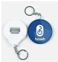
Gambar 14. Gantungan Kunci