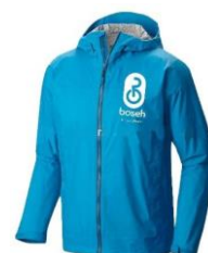
Gambar 9. Jas Hujan