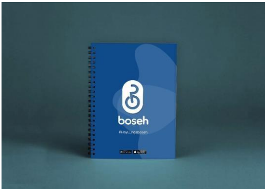
Gambar 12. Notebook