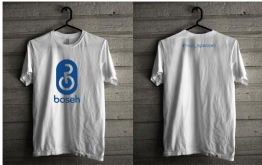
Gambar 10. Kaos