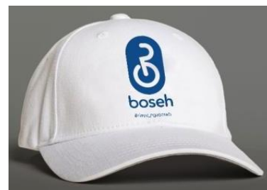
Gambar 7. Topi