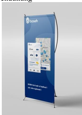
Gambar 4. X Banner