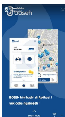
Gambar 6. Instagram Ads