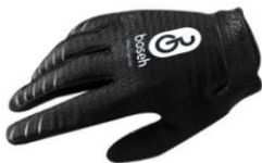
Gambar 16. Sarung Tangan