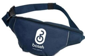
Gambar 8. Waist Bag