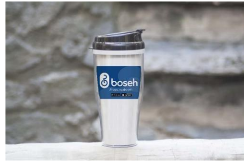
Gambar 11. Tumbler