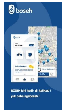
Gambar 5. Poster