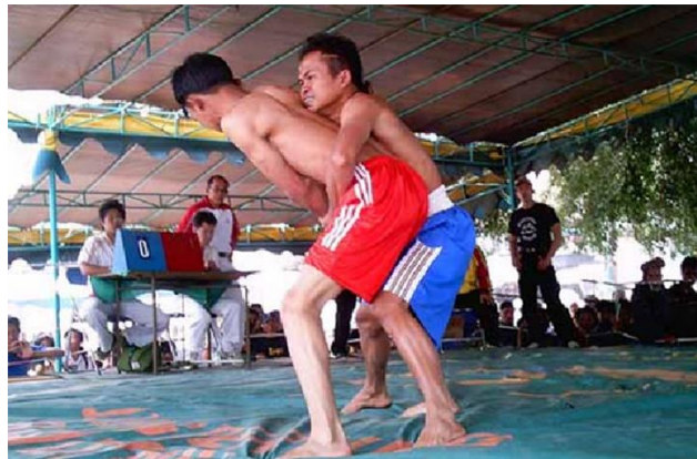
Gambar 1. Gelut Benjang