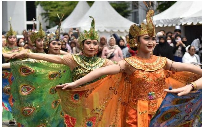
Gambar 3. Ribuan perempuan cantik membawakan Tari Merak Kolosal di pelataran Gedung Sate, Kota Bandung

Indonesia merupakan negara yang terkenal memiliki kekayaan, keindahan sumber daya alamnya, tidak hanya itu Indonesia juga kaya akan keberagaman budayanya, menurut sensus BPS tahun 2010 mulai dari Kota Sabang hingga Kabupaten Merauke yang terbentang Indonesia memiliki 1.340 suku bangsa. Kebudayaan itu sendiri adalah segala sesuatu yang berkaitan dengan cipta, rasa, karsa, dan hasil karya masyarakat[5], yang juga merupakan cara hidup yang berkembang dan dimiliki oleh bersama serta diwariskan dari generasi ke generasi berikutnya khususnya di Suku Sunda banyak sekali warisan budaya yang harus terus dilestarikan. Kota Bandung sendiri memiliki beragam kebudayaan khususnya Budaya Sunda yang masih dilestarikan hingga saat ini, di antaranya terdapat kesenian Tari Merak, Alat Musik Angklung, Bangunan Cagar Budaya, hingga Olahraga Tradisional khas Kota Bandung yang salah satunya merupakan Gelut Benjang yang berasal dari Ujungberung.