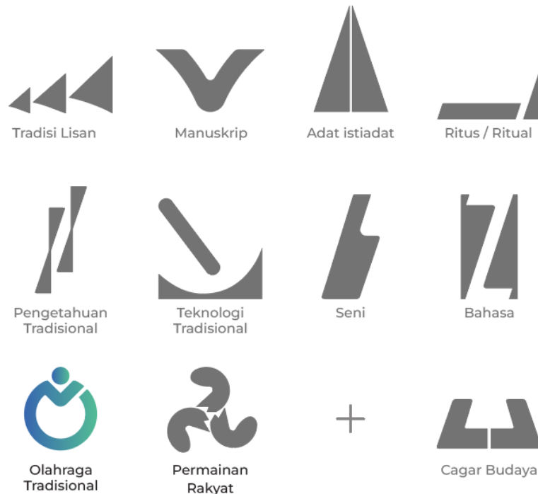
Gambar 4. Ikon 10+1 OPK Kota Bandung

Berikut merupakan hasil dari perancangan 10+1 Ikon OPK Kota Bandung ditampilkan pada Gambar 14.