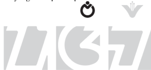
Gambar 4. Ikon OPK Olahraga Tradisional dalam Logo 10+1 OPK Kota Bandung

Ikon Olahraga Tradisional dirancang sebagai bentuk representasi salah satu olahraga tradisional yang ada di Kota Bandung. Visual ikon ambil dari salah satu objek yang terdapat pada Logo utama 10+1 Objek Pemajuan Kebudayaan Kota Bandung seperti yang ditampilkan pada Gambar 1.