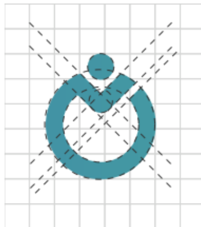
Gambar 10. Proses Digitalisasi Sketsa Ikon Olahraga Tradisional

Sketsa ikon kemudian didigitalkan yang bertujuan untuk menyempurnakan bentuk serta untuk dimasukkan ke dalam logo 10+1 OPK Kota Bandung. Pada tahapan ini ikon didigitalkan dengan menggunakan metode Grid System agar bentuk ikon menjadi lebih tertata dan simetris.