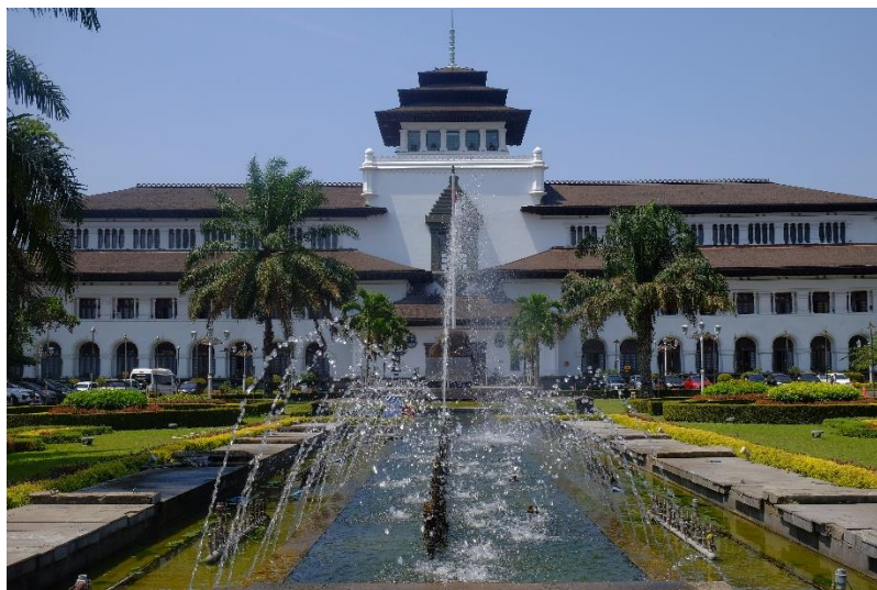
Gambar 2. Gedung Sate

Kota Bandung merupakan salah satu kota yang terletak di Provinsi Jawa Barat serta merupakan Ibu Kota provinsi dengan luas 167.3 km 2 yang terkenal oleh mayoritas masyarakat Suku Sunda[3]. Kota Bandung memiliki julukan Kota Kembang karena terkenal dengan keindahan alamnya mulai dari pepohonan yang memayungi jalanan, banyak destinasi wisata yang bertema alam, dan masih banyak lagi. Julukan tersebut pertama muncul pada saat jaman kolonial Belanda, yang pada masa itu Kota Bandung terkenal sebagai pusat industri kebun bunga[4], kata " Kembang " sendiri berasal dari Bahasa Sunda yang artinya bunga. Tidak hanya itu, Kota Bandung Juga memiliki berbagai macam kearifan budaya lokal meliputi kesenian tradisional, tradisi Masyarakat, Olahraga tradisional dan lain sebagainya yang masih dilestarikan hingga saat ini.