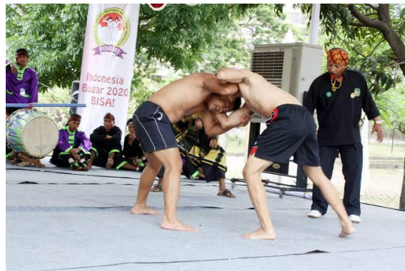
Gambar 5. Gelut Benjang dari Ujungberung

Gelut Benjang merupakan salah satu olahraga tradisional Kota Bandung yang berasal dari Kecamatan Ujungberung. Olahraga ini biasa ditampilkan pada acara hajatan seperti khitanan, serta acara penting lainnya di wilayah Ujungberung. Pemilihan Olahraga ini dikarenakan bentuk visual pada saat dimainkan memiliki kesamaan dengan salah satu bentuk visual yang terdapat dalam Logo 10+1 OPK Kota Bandung, sehingga dapat dilakukan penyederhanaan bentuk serta perancangan sketsa.