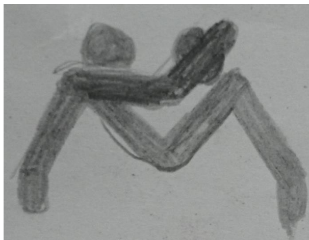
Gambar 8. Penyederhanaan Bentuk Visual Gelut Benjang

Penyederhanaan bentuk visual Olahraga Gelut Benjang kemudian akan dijadikan patokan sketsa ikon seperti pada Gambar 8.